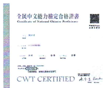
※初~中高等證書證號示意圖