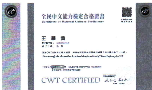
※高、優等證書證號示意圖